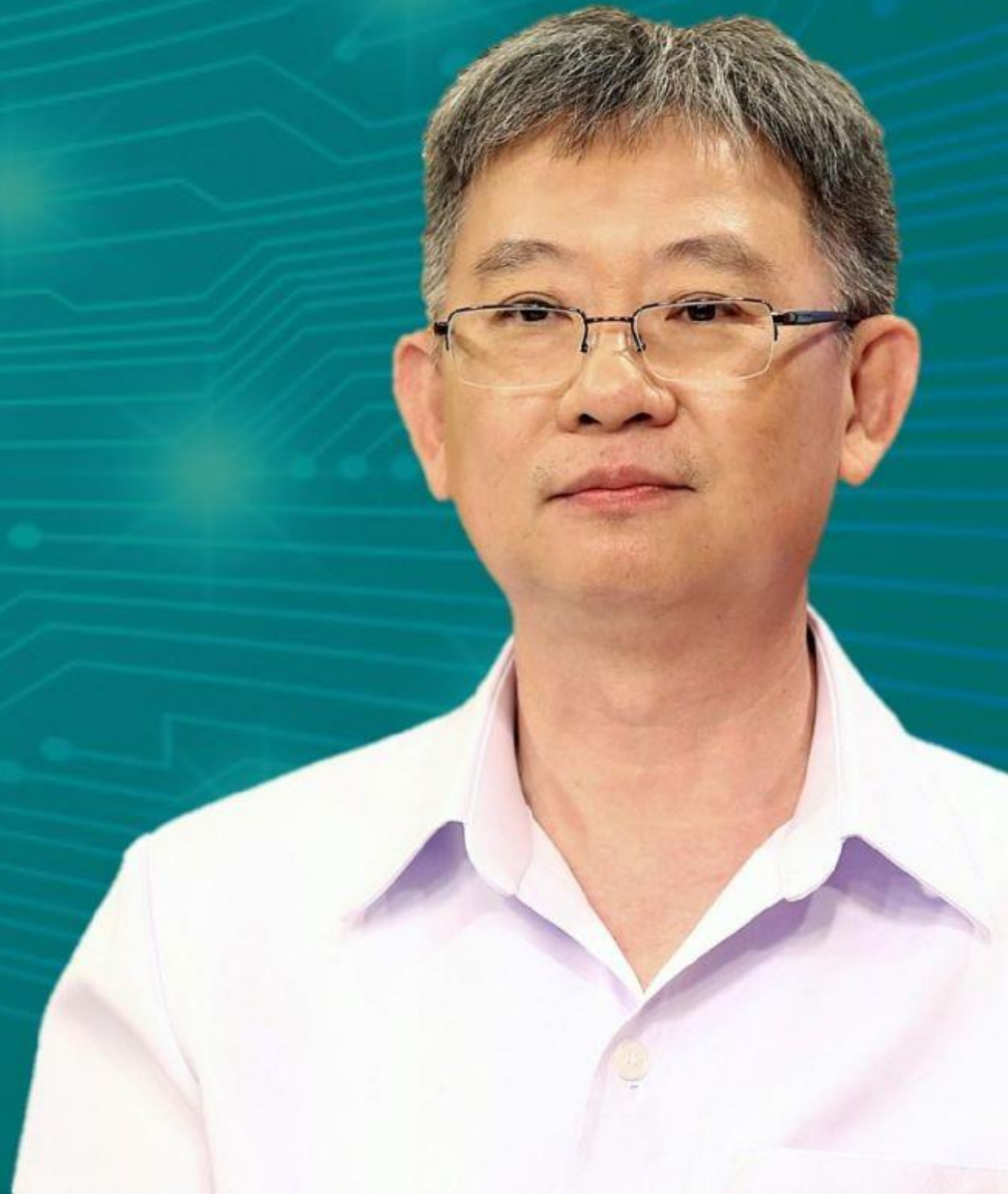
นายแพทย์โอกาส การย์กวินพงศ์ ปลัดกระทรวงสาธารณสุข